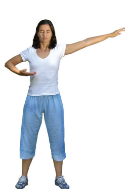
1 Bouddha étend ses mille bras

Par des mouvements d'étirement légers, le premier exercice permet de dégager tous les méridiens du corps, créant ainsi un fort champ d'énergie.