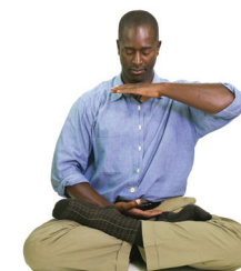
5 Renforcer les pouvoirs divins

Les mains se meuvent autour du corps, sur l'avant et l'arrière. Ce quatrième exercice permet à l'énergie de circuler librement dans le corps.