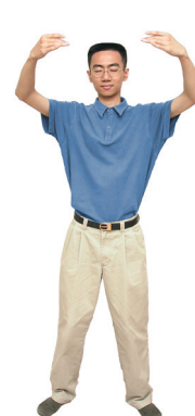
2 Pratiquer le Falun debout

Par des mouvements d'étirement légers, le premier exercice permet de dégager tous les méridiens du corps, créant ainsi un fort champ d'énergie.