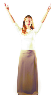
3 Pénétrer les deux pôles cosmiques

Enchaînement de quatre postures tenues chacune plusieurs minutes. Cet exercice est une méditation en position debout développant force et sagesse.