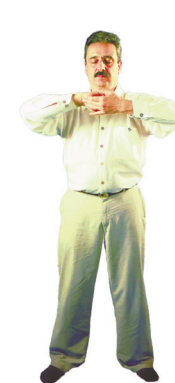
4 Le circuit céleste du Falun

Les mains montent et descendent en flottant ; ce troisième exercice purifie le corps en mêlant son énergie à celle de l'univers.